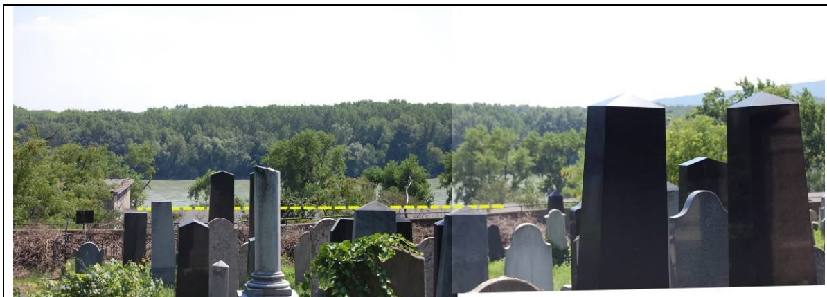
Pohľad z cintorína na podunajskú krajinu (júl 2008). Žltou prerušovanou čiarou je zvýraznený hrebeň haly PKO.

Rovnako dôležité je zachovanie možnosti pohľadov zo svahu smerom na Dunaj. Blízko PKO sa zhodou okolností nachádza niekoľko významných historických cintorínov (18., 19. stor.). Ide o štruktúry s veľmi osobitou atmosférou ktorú spoluvytvára historická architektúra, staré náhrobníky a zeleň. Hoci sú dnes cintoríny súčasťou zástavby, možnosť výhľadu na širokú „nedotknutú“ dunajskú krajinu zostal naďalej neodmysliteľným privilegiom jeho návštevníkov.